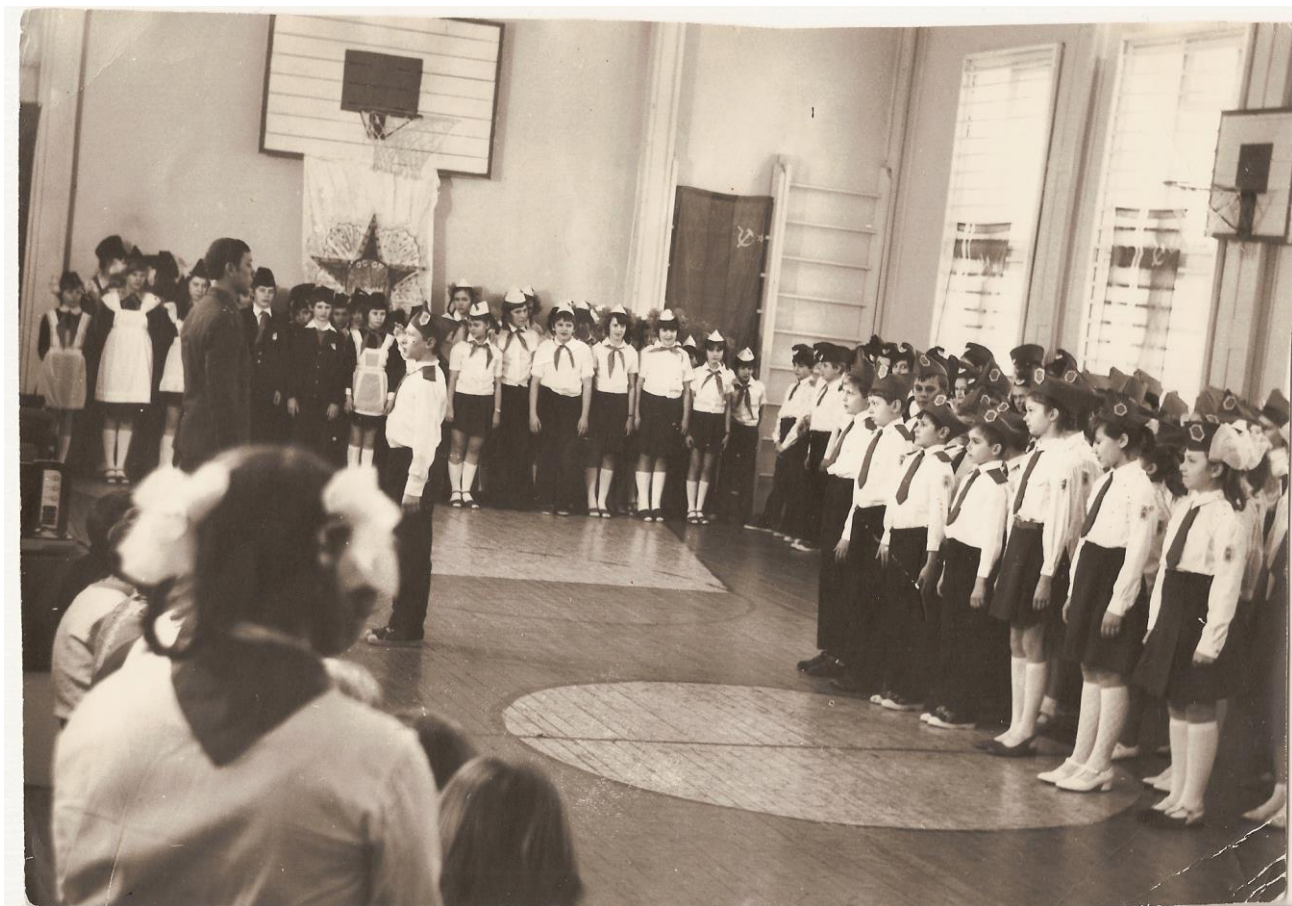
На снимке: Смотр строя и песни, посвящённого Дню Советской Армии и Военно - Морского Флота. (1985 г)

отряд рапортовал: сколько килограммов лекарственных трав собрал, сколько сложил поддонов кирпичей на стройке.