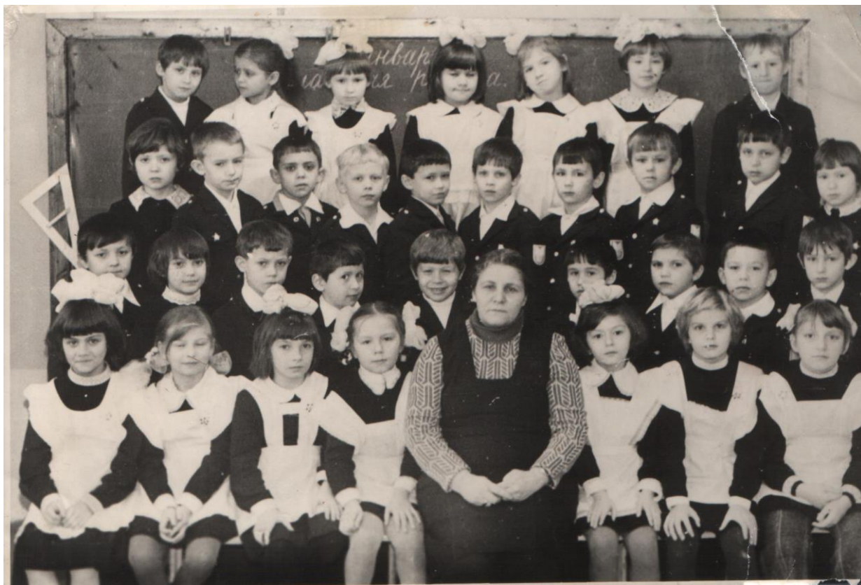
На снимке: ученики первого класса 1979 года.