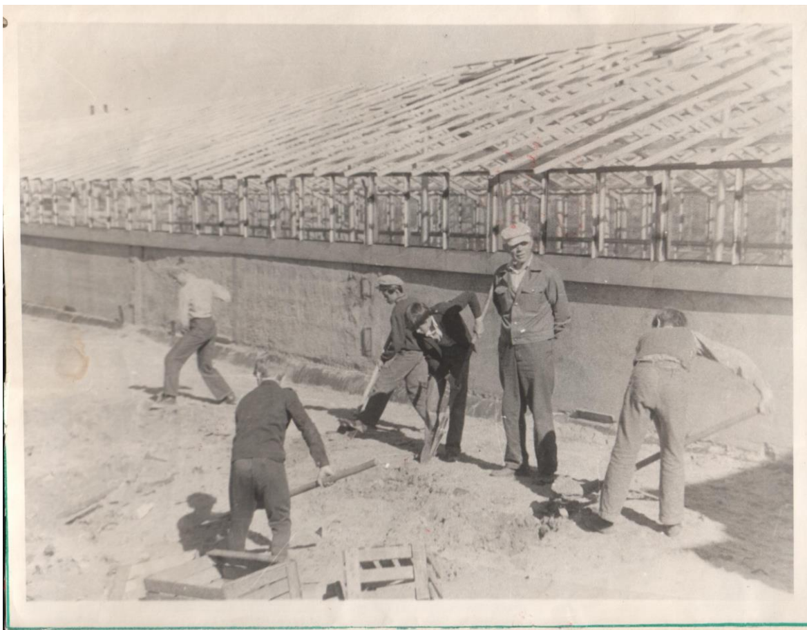
Работа трудовой ученической бригады на территории теплиц УМ – 3 треста «Сургуттрубопроводстрой». (июнь 1983 г)

В июне месяце начиналась пятая трудовая четверть. Ученические трудовые бригады работали на территории базового предприятия «СТПС» . Часть заработанных денег ученики перечисляли в Фонд мира.