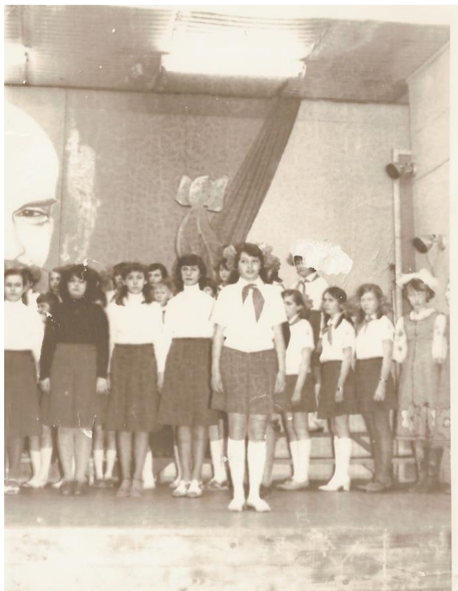
Школьный хор. (1980 г)