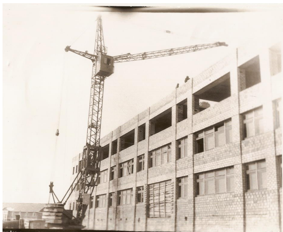
Строительство новой школы. (1986 г)