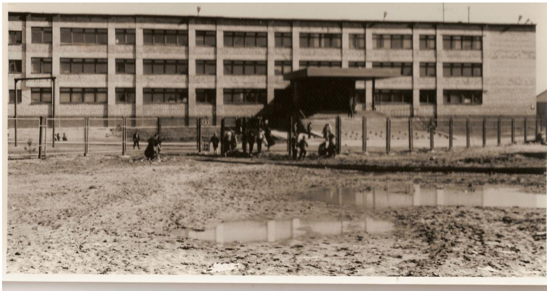
Здание Барсовской средней школы № 2 (1987 г)