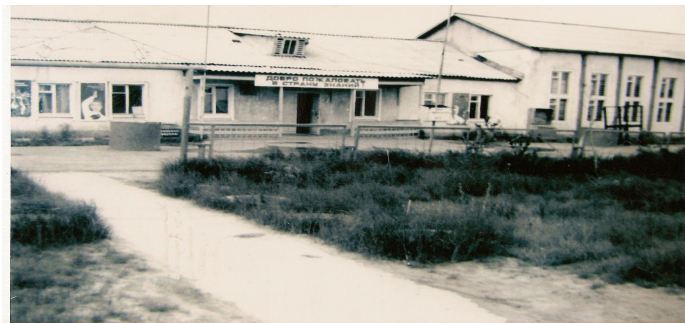
На снимке: Здание Барсовской восьмилетней школы № 2 (1979 год)

Строили школу «всем миром»: учителя, ученики и их родители, - основным застройщиком было строительное управление – 27 треста «Сургуттрубопроводстрой». Одна из первых учителей школы, Пронина Н.А. вспоминает: «Все хотели быстрее закончить строительство, делали всё своими руками: строили, утепляли... Учителя с учениками и их родителями знакомились на стройке»