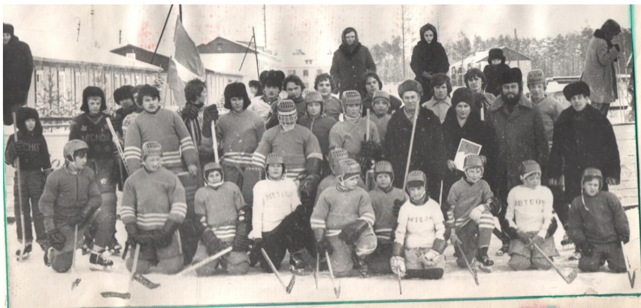
Школьная хоккейная команда (1981 г)

Ежегодно школа принимала активное участие в смотрах художественной самодеятельности среди школ района и неоднократно занимала призовые места.