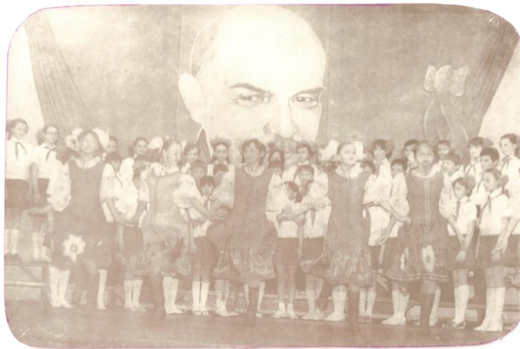
Выступление школьного коллектива на районном конкурсе (1980 год)

Ежегодно школа принимала активное участие в смотрах художественной самодеятельности среди школ района и неоднократно занимала призовые места.