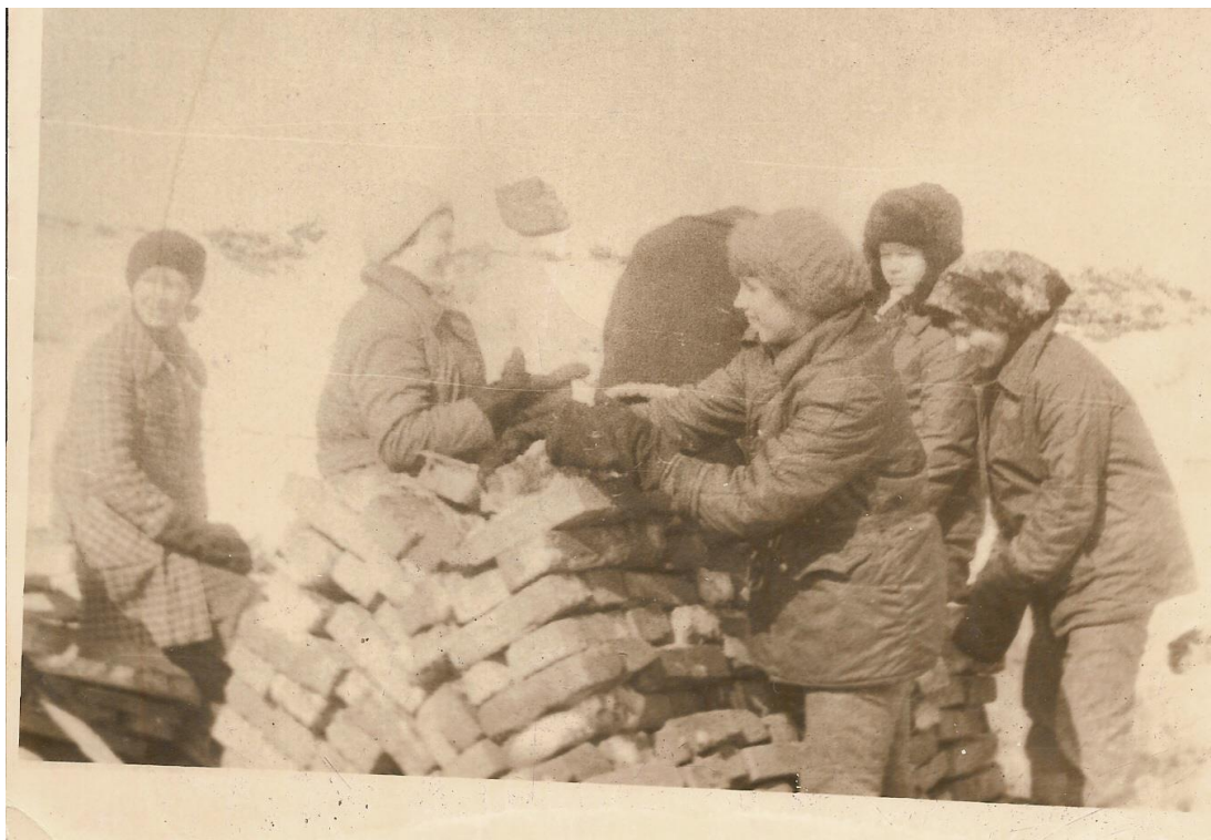
Ученики и педагоги на строительстве новой школы. (1986 год)

Педагоги и ученики принимали активное участие в строительстве новой школы. Ежедневно после занятий в школе ученики с педагогами отправлялись на субботник, на строительство новой школы. Было организовано соревнование среди классов, кто больше всех сложит поддонов с кирпичами – это был вклад в строительство нового здания школы.