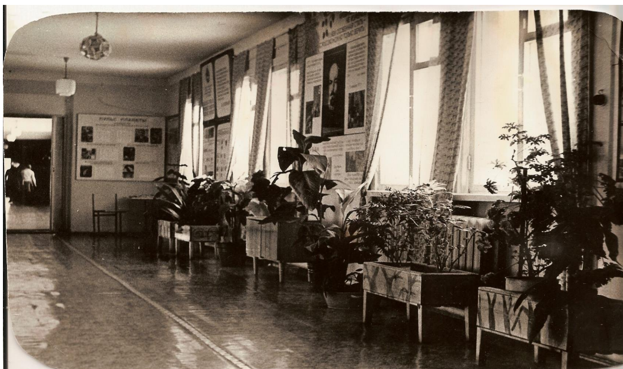
Рекреация Барсовской восьмилетней школы № 2