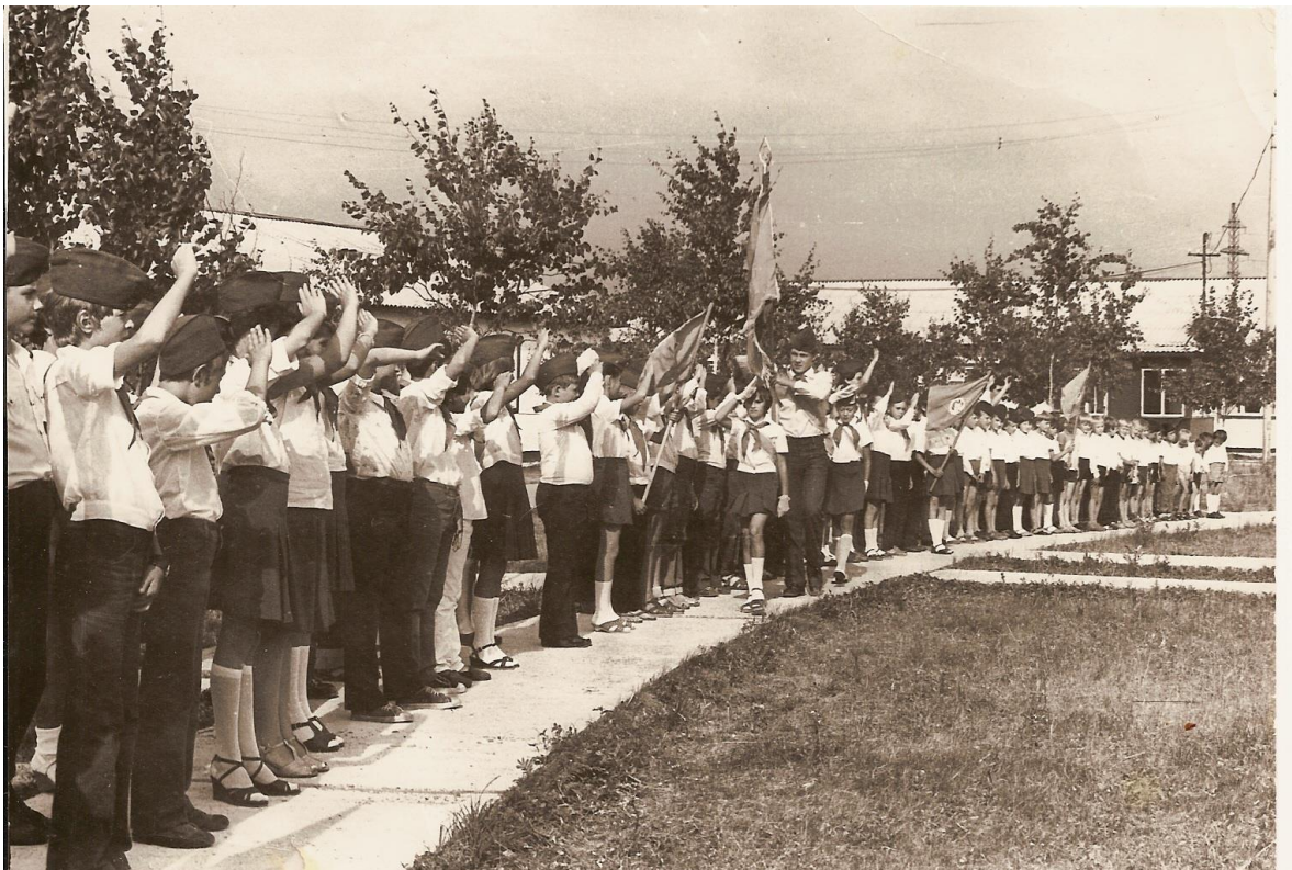
На снимке: Пионерский сбор (1983 г)

В 1981 году пионерской дружине школы присвоено имя Героя Советского Союза Зои Космодемьянской. Пионерская дружина нашей школы вела переписку с учениками школы села Петрицево Московской области, там, где в 1941 году немцы казнили молодую партизанку, назвавшуюся Таней. На самом деле её звали Зоя Космодемьянская. По просьбе учеников школы, одну из улиц посёлка назвали в честь Зои Космодемьянской.