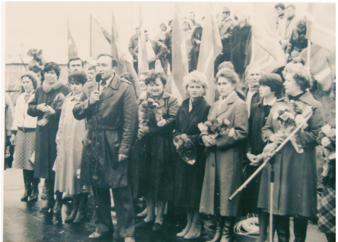
Торжественная линейка, посвящённая началу нового учебного года. Поздравление представителей треста «Сургуттрубопроводстрой». (1985 г)

В 1983 году было завершено строительство пристройки к основному зданию школы.